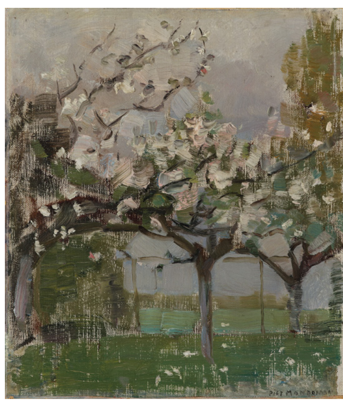
Piet Mondrian (1872-1944), Alberi in fiore , 1902-1905 o 1916-1918. Olio su tela su cartoncino. Kunstmuseum Den Haag 0334226