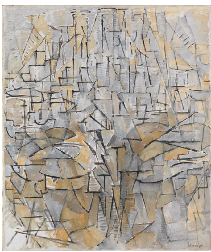
Piet Mondrian (1872-1944), Tableau n. 4 / Composizione n. VIII / Composizione 3 , 1913, Olio su tela. Kunstmuseum Den Haag 0334317